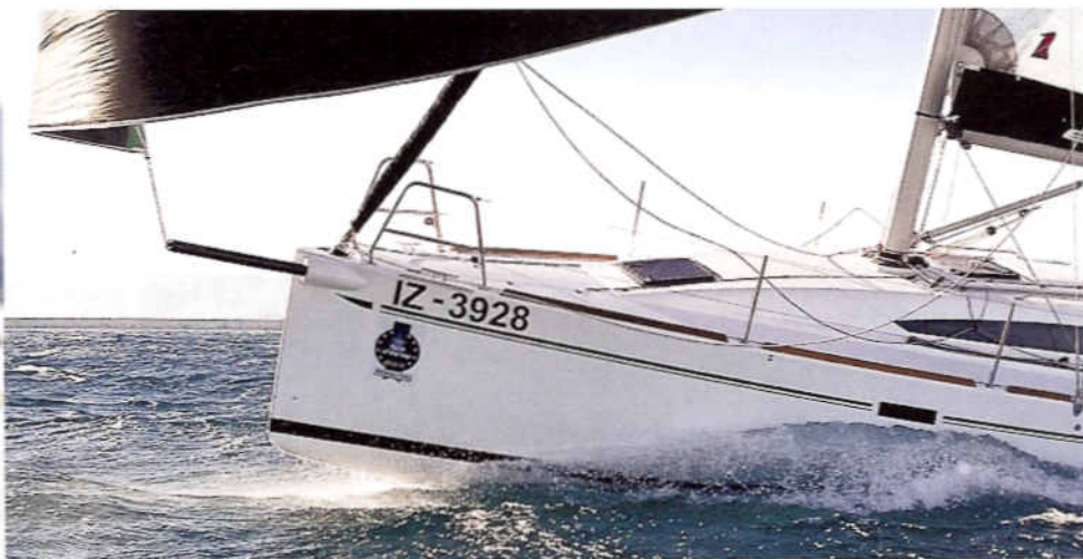
BOVEN Zo ziet 15 knopen in plané eruit. Kicken zonder pilletje!

D e Elan 350 won dit jaar de European Yacht of the Year-verkiezing in de categorie 'performance cruisers'. Wat ons betreft terecht, want de 350 is in zijn klasse een van de fijnste zeilboten die wij ooit hebben mogen testen. En u kent ons inmiddels wel een beetje, zo'n boude uitspraak doen we niet snel. Een goede performance cruiser ontwerpen is niet eenvoudig. Het risico dat de boot te veel op twee gedachten hinkt is namelijk groot. Voor je het weet is de boot te sportief om nog eenvoudig gezeild te kunnen worden, of haalt hij de performance-beloofte niet omdat hij te veel cruiser is. De reden dat we zo enthousiast zijn over de Elan 350 is dat hij die balans perfect weet te vinden. Daarnaast is het een echte geweldenaar, die prestaties laat zien die een paar jaar geleden nog ondenkbaar waren.