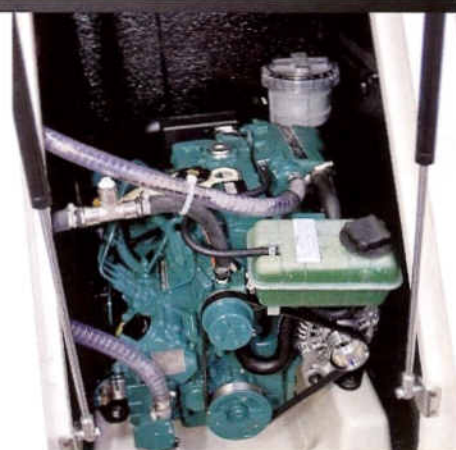
Standaard is de boot voorzien van een 30 pk Volvo met saildrive.

Het ontwerp van de Elan 350 volgt niet zomaar klakkeloos de huidige trend, maar laat zien wat de toekomst is voor performance cruisers. Als een van de eerste zeilboten in zijn klasse laat hij de nieuwe vindingen uit het racecircuit echt voor zich werken. De zeileigenschappen zijn zonder